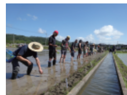
「田植え」体験の様子