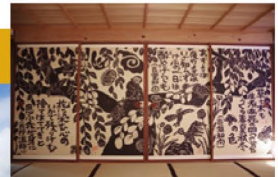
毎来寺(版画アート)