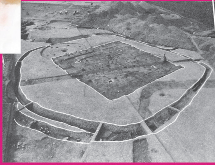
古墳時代の大型住居 岡山県埋蔵文化財発掘調査報告 11 より引用