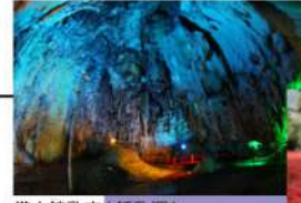
備中鍾乳穴(鍾乳洞)