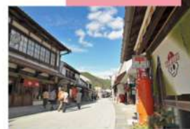
勝山町並み保存地区