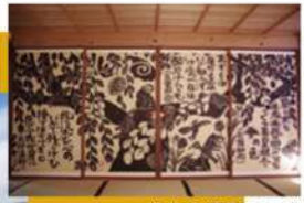
毎来寺(版画アート)